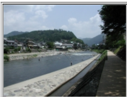
鮎釣りでにぎわう吉田川

ぼくは自転車を積んできたので無料の駐車場へ車を止めて早速吉田川へ行きました。川ではたくさんの方が鮎釣りをしていました。はじめはテレビでやっていた橋から飛びたかったのですが橋から下をのぞき込むと怖かったのでやめました。自転車で走っていると学校橋という橋がありました。その下流にちょっと大きな岩があってお兄さんたちがジャンプして遊んでいました。高さは6～7メートルぐらいだと思うのですが実際に上ってみるとすごく高く感じました。ぼくはこれなら行けそうだったのですがこのジャンプのために新調した水着に着替えました。着替えているとお父さんお母さんと来ているお兄さんに会いました。たぶん5年生ぐらいだと思いました。そのお兄さんはもう4回も来ているのに怖くて飛び込めないそうです。だらしないと思いました。飛び込む前に近くで泳ぎました。川は深く澄んでいて鮎が泳いでいるのが見えました。冷たかったです。水からあがって岩に上りました。いざとなると少し怖い気がしました。しゃがんでいるのと立つのでは全然怖さが違いました。ぼくは何度も高飛び込みの台から飛んでいるのですが、足下が安定しないので感じが違いました。下に誰もいないのを確認して岩の縁に足をかけました。さっきの家族が僕のことを見ていました。一呼吸して僕は地球の中