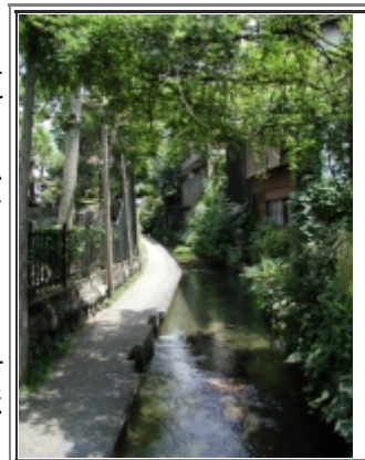
いがわ小径、いい感じです

トンネルをいくつも抜けて郡上八幡の町に着きました。郡上八幡の町ではなるべく町の外に車を止めて歩いてまわってほしいというキャンペーンをやっていました