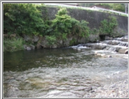
ポイントです。釣れそうでしょ。

でいつでも遊べるのはうらやましいと思いました。しばらく走っていると取水用の堰がありました。ちょうど堰の下に深いところがあったのでそこを狙いました。写真の対岸のところですか。えさはぶどう虫というくにゅくにゅした白い虫を使いました。目印の位置を調整して第一投、するとすぐ目印が不自然な動きをしました。軽く合わせると早速1匹めがかかりました。