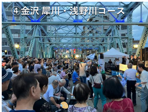
④金沢 犀川・浅野川コース