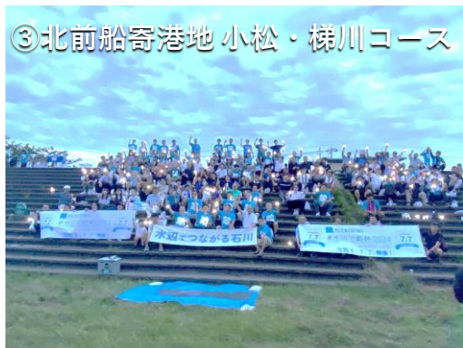
③北前船寄港地 小松・梯川コース