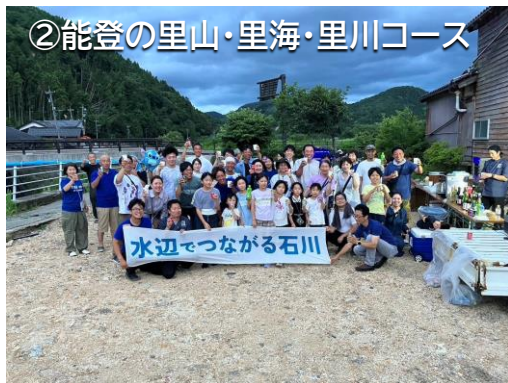
②能登の里山・里海・里川コース