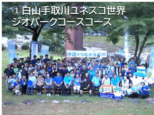
①白山手取川ユネスコ世界ジオパークコース