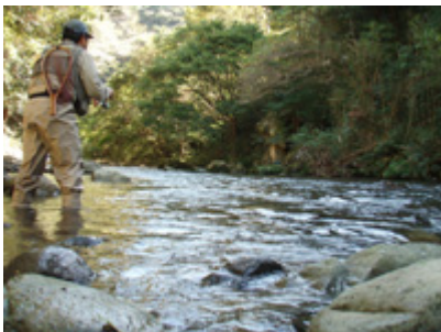
セルフタイマーに挑戦。