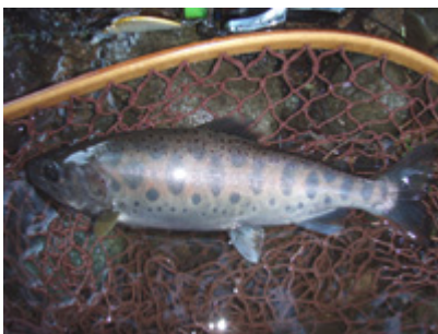
8寸サイズのアマゴ。