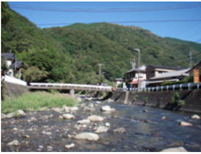
中流部は里川の様相。

瀬が交互に現れ、ポイントに困ることはなさそうです。そんな中まずヒットしたのはアブラハヤ。外道ですがとりあえずボウズはなくなったし、生命反応があったことが嬉しい。よし、行けそうだとキャストを続けます。