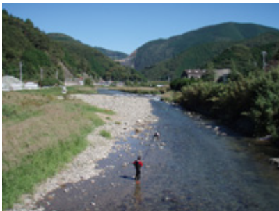
下流部は鮎の釣り場として有名。