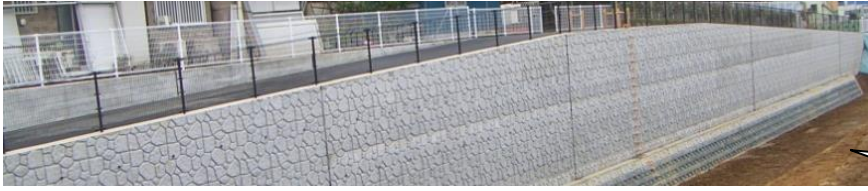
整備が終わった新川の一部