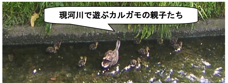
現河川で遊ぶカマガモの親子たち