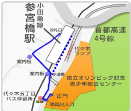
横断歩道を使った経路