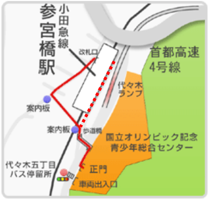
歩道橋を使った経路